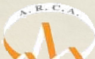
Associazioni Regionali Cardiologi Ambulatoriali A.R.C.A. - Puglia